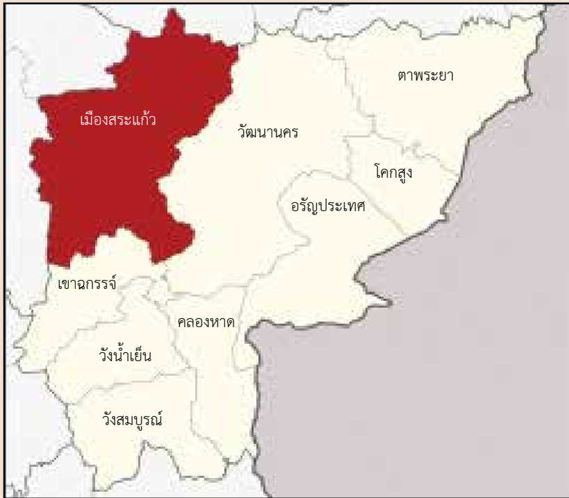
แผนที่อำเภอเมืองสระแก้ว จังหวัดสระแก้ว