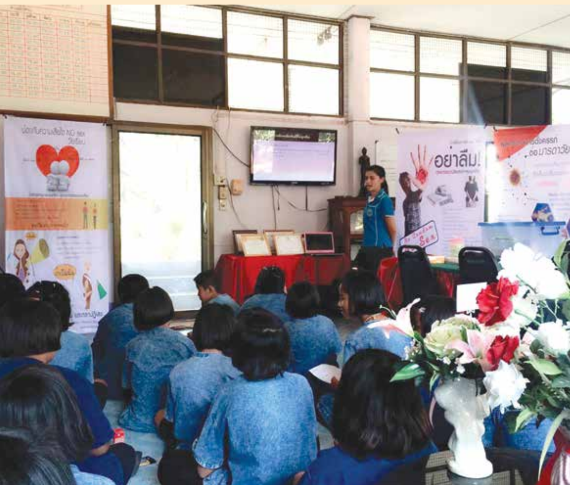
กิจกรรมอบรมให้ความรู้ในการป้องกันการท้องก่อนวัยอันควร