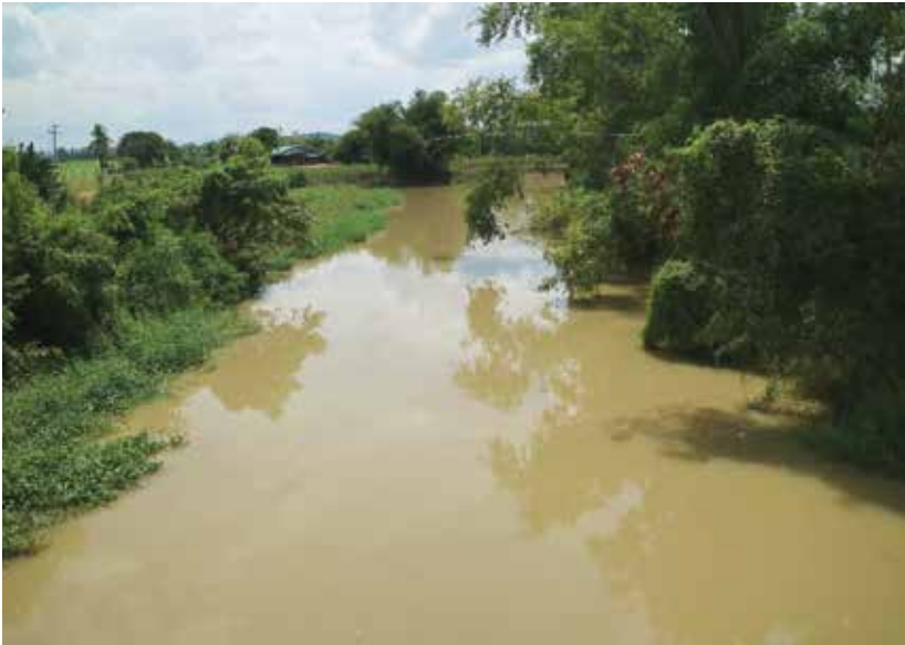
รูปภาพคลองตาหลัง