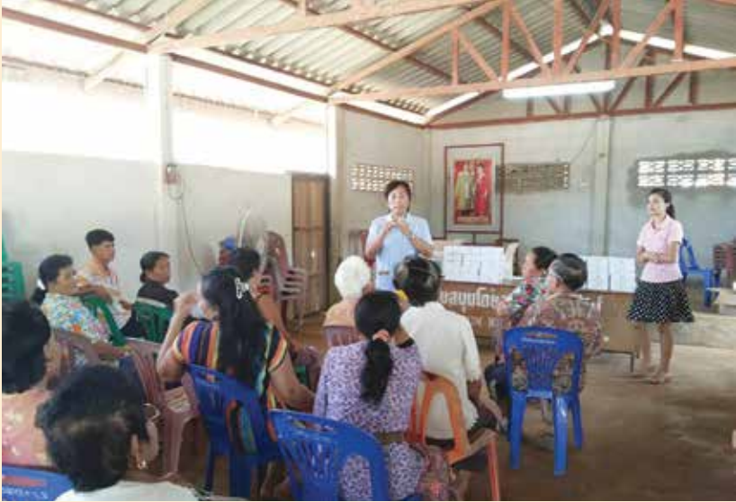
การจัดอบรมให้ความรู้ผู้ป่วยในการดูแลสุขภาพตนเองเบื้องต้น