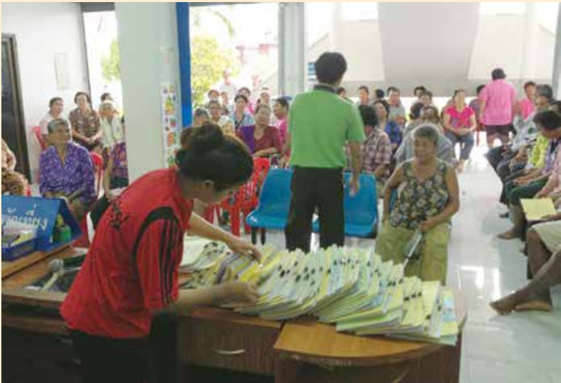
โรงพยาบาลส่งเสริมสุขภาพตำบลตาหลังในตรวจคัดกรองผู้ป่วยประจำปี