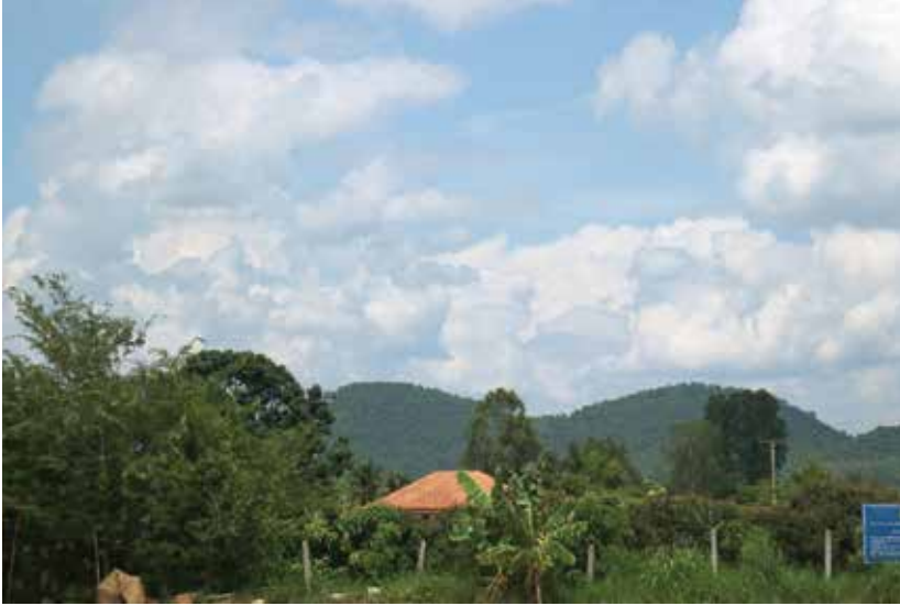
ทิวเขาตามแนวหมู่บ้านตาหลังใน