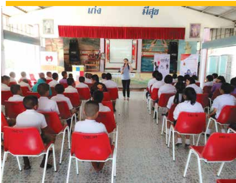
กิจกรรมอบรมให้ความรู้ในการป้องกันการท้องก่อนวัยอันควร

ในขณะที่เดียวกันนั้น ทางโรงพยาบาลส่งเสริมสุขภาพตำบล ได้จัดทำโครงการอบรมเพื่อป้องกันการตั้งครรภ์ก่อนวัยอันควรของเยาวชนในตำบลตาหลังใน โดย รพ.สต. ตาหลังใน มีกลุ่มที่เรียกว่า “วัย teen age” คือ กลุ่มวัยรุ่นที่ตั้งครรภ์ก่อนวัย ซึ่งในพื้นที่ตาหลังในมีขึ้นทะเบียนทั้งหมด 17 คน ทาง รพ.สต. ได้มีการวางแผนในการดำเนินงานสำหรับกลุ่มนี้ และได้จัดทำโครงการเพื่อออกไปให้ความรู้ในเรื่องการคุมกำเนิด โดยจะจัดทุกปี ๆ ละครั้ง เป้าหมายคือ เด็กเยาวชนในโรงเรียน และมีการร่วมมือกันระหว่างโรงเรียนกับ รพ.สต. ในการให้คำปรึกษาเกี่ยวกับการมีเพศสัมพันธ์แก่เด็กเยาวชนจากการร่วมมือกันดำเนินงานประสบผลสำเร็จเป็นอย่างดี ส่งผลให้ในตำบลตาหลังในไม่มีเยาวชนที่ท้องก่อนวัยอันควรเพิ่ม