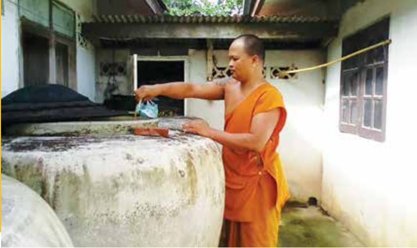
กิจกรรมรณรงค์การป้องกันโรคไข้เลือดออกในชุมชนตำบลตาหลังใน