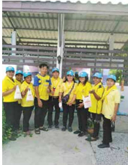
กิจกรรมรณรงค์การป้องกันโรคไข้เลือดออกในชุมชนตำบลตาหลังใน