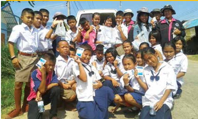
กิจกรรมรณรงค์การป้องกันโรคไข้เลือดออกในชุมชนตำบลตาหลังใน

โรงพยาบาลส่งเสริมสุขภาพตำบลจึงได้จัดกิจกรรมรณรงค์และให้ความรู้เกี่ยวกับการป้องกันโรคไข้เลือดออกโดยได้มีการจัดอบรมให้กับ อสม. ทุกหมู่บ้าน เพื่อให้มีองค์ความรู้ในการควบคุมโรคไข้เลือดออก และจัดกิจกรรมในการควบคุม ป้องกันโรคไข้เลือดออกภายในชุมชนของตนเอง เช่น การควบคุมลูกน้ำยุงลาย การทำความสะอาดบริเวณบ้าน ตัดหญ้า จัดการภาชนะที่มีน้ำขัง หรือ การใส่ทรายอะเบทในอ่างน้ำ ซึ่งสังเกตได้จากแผนที่เจ้าหน้าที่ รพ.สต. ตาหลังใน ลงไปสำรวจลูกน้ำยุงลาย พบว่า ค่า House Index (HI) และค่า Container Index (CI) ของหมู่บ้านไม่เกิน ร้อยละ 10