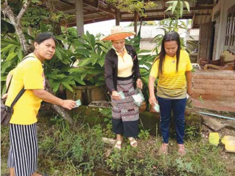
กิจกรรมรณรงค์การป้องกันโรคไข้เลือดออกในชุมชนตำบลตาหลังใน

ทั้งนี้ การให้ความรู้ของ รพ.สต. ผสมกับการให้ความร่วมมือของคนในชุมชน ทำให้การควบคุมและป้องกันโรคไข้เลือดออกภายในชุมชน มีสถานการณ์ที่ดีขึ้นตามลำดับ จนกระทั่งสามารถควบคุมโรคไข้เลือดออกไม่ให้ระบาดในชุมชนอื่นได้สำเร็จ โดยใช้หลักการให้ทุกคนในครัวเรือนสามารถดูแลความสะอาดภายในครัวเรือนเองก่อนแล้วจึงช่วยกันดูแลชุมชนของตนเองให้สะอาดและปลอดภัยจากโรคร้ายต่าง ๆ ที่จะเกิดขึ้นกับคนในชุมชน นำไปสู่การมีสุขภาพที่ดีของคนในชุมชนได้อย่างยั่งยืน